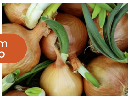
Cebola sem tratamento

Evita o espigamento da cebola armazenada com uma só aplicação no campo